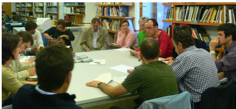
Figura 2. Fotografia de la comissió de treball de qualitat ambiental, educació ambiental i mobilitat del Fòrum Ciutadà de l'Agenda Local 21