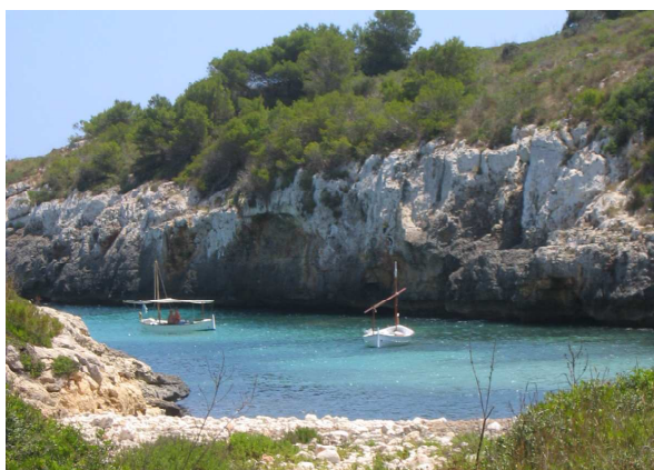
Figura 1. Fotografia de Cales Verges de Manacor

A nivell internacional, esdeveniments com la Cimera de la Terra (Rio de Janeiro, 1992), la Cimera Mundial pel Desenvolupament Sostenible (Johannesburg, 2002) i les Conferències Europees de Ciutats i Pobles Sostenibles (Aalborg, 1994; Lisboa, 1996; Hannover, 2000; Aalborg + 10, 2004), han consolidat les bases per a què qualsevol societat pugui adoptar les mesures pertinents per encaminar el seu territori cap a la sostenibilitat.