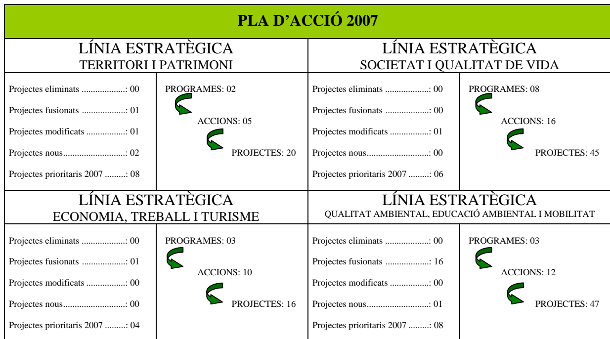
Figura 2. Taula resum sobre l’actualització del Pla d’Acció de l’AL21 de Manacor.