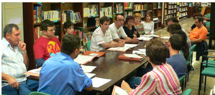
Figura 3. Fotografia de la comissió de treball de qualitat ambiental, educació ambiental i mobilitat del Fòrum Ciutadà de l'Agenda Local 21