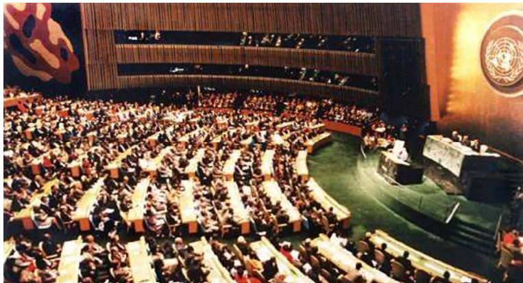
Figura 1. Fotografia de l'Assamblea General de les Nacions Unides

A nivell internacional, esdeveniments com la Cimera de la Terra (Rio de Janeiro, 1992), la Cimera Mundial pel Desenvolupament Sostenible (Johannesburg, 2002), les Conferències Europees de Ciutats i Pobles Sostenibles (Aalborg, 1994; Lisboa, 1996; Hannover, 2000; Aalborg + 10, 2004), han consolidat les bases per a què qualsevol societat pugui adoptar les mesures pertinents per encaminar el seu territori cap a la sostenibilitat.