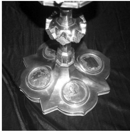
Detall del peu i el nuu