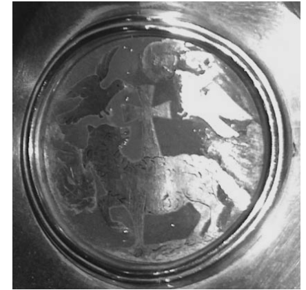
Anyell de Déu