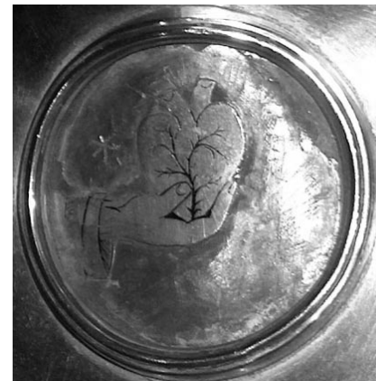
Escut de Manacor