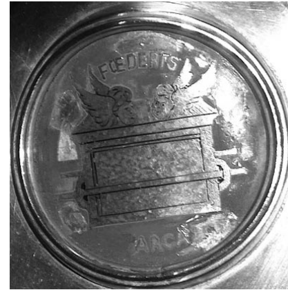
Arca de l'Aliança

El segon grup d'esmalts es troba al peu de la peça i, per tant, seria de factura posterior als del cos principal. En aquest cas combinen la tècnica de l'esmaltat, en color cel turquesa i el niellat, per als detalls de les figures. Tenen forma circular i hi apareixen les representacions de Santa Maria la Major, titular de la parròquia a l'època de factura de la peça, l'Arca de l'Aliança, l'Anyell de Déu i l'escut de Manacor, en el qual destaquen la representació de les venes i l'aorta i la cava que sorgeixen de la part superior del cor. Aquesta representació de l'escut de la vila ens permet afirmar que aquest esmalt, i per tant el grup de quatre esmalts, ha d'ésser bastant posterior a l'època de realització de la peça en si, ja que a les representacions de l'escut de Manacor, almanco fins al segle XVII, la ma no sosté el cor, sinó que aquest és aguantat per la punta dels dits, tal com es pot veure a les representacions en escultura que hi ha a les antigues creus de camí, conservades al Museu d'Història de Manacor, o al que hi ha dibuixat sobre un dels portals del pis inferior del claustre dels dominics.