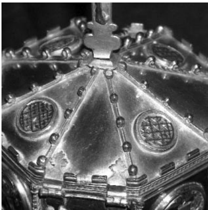
Detall de la tapadora