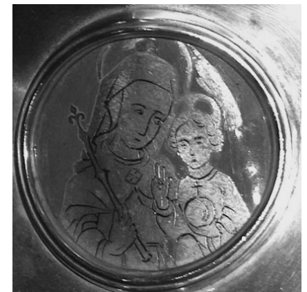
Santa Maria la Major