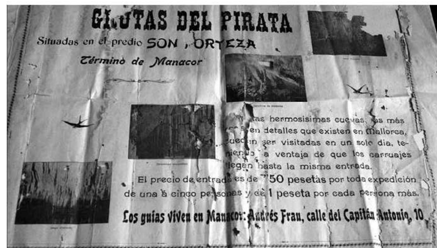
Cartell anunciador de les coves del Pirata.