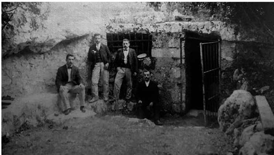
Reixat que barrava l'entrada a les coves.