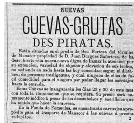
Publicitat de les coves del Pirata (1881).