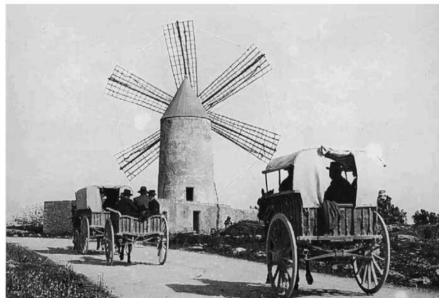
Instantània d'una passejada fins al Port, a l'altura del Moli den Sopa.