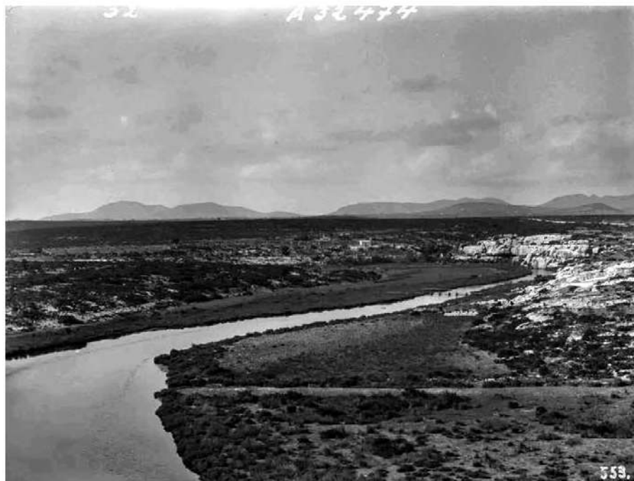
Cala Manacor cap al 1890.

Quant a les coves del Drac, no escapa a ningú que ja eren conegudes a nivell local des d'època antiga. De temps tan remots cal destacar la presència al seu interior d'un corredor ciclopi així com d'abundants fragments de ceràmica prehistòrica i islàmica, restes que testimonien l'ús de la cavitat com a amagatall i refugi temporal molt abans de la conquesta cristiana de 1229. Ja al segle XVI, conformaven un element geogràfic perfectament identificable, com ho prova la descripció que en fa el prevere manacorí Joan Binimelis l'any 1595 quan parla de Cala Manacor: «En la fi d'esta cala esta la Cova que diuen del Drac, tan nomenada, en tot semblant a la Cova de l'Ermita, del terme d'Arta». L'existència d'un grafit signat pel prevere manacorí Mn. Miquel Servera Riera el 17 de setembre de 1702 ens permet documentar que, aleshores, la cavitat era objecte d'exploracions pel simple plaer de contemplar-les.