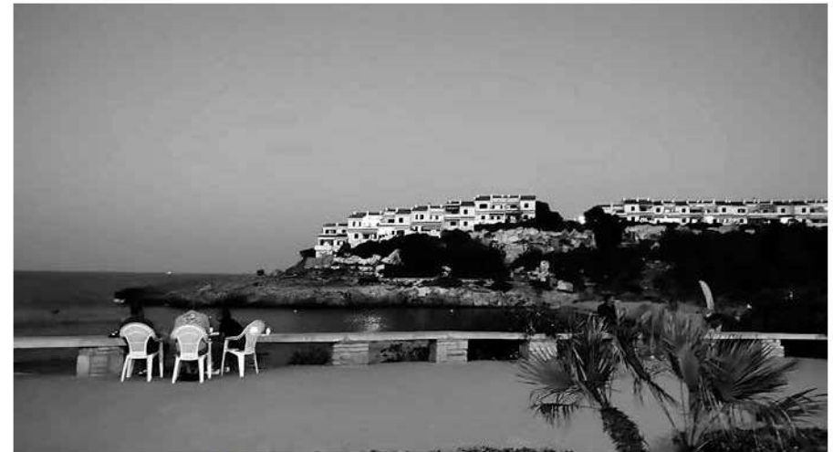
Grup de persones sopant al passeig.

Un dels llocs que els locals consideren més emblemàtic és la zona de la platja i el petit moll que encara es conserva i que de vegades s'utilitza per fer navegar petites embarcacions recreatives. Prop d'allà hi ha una casa rupestre abandonada i tapiada. Pertany a la propietat de sa Plana i era la residència d'estiueig dels senyors, que vivien a Palma. Segons el Nomenclàtor Geogràfic de les Illes Balears, la construcció rep el nom de sa Casa Empotrada. Els locals s'hi refereixen com la casa de la roca , la casa-cova o la casa troglodita , entre d'altres denominacions. Pel que sembla, alguns alemanys diuen que era una presó però es tracta d'un fet inventat. A la cova, s'hi han trobat evidències del seu ús durant diferents èpoques: talaiòtica, medieval islàmica i medieval cristiana. El lloc disposa d'una protecció BIC, s'hi han pintat alguns gargots amb esprai, hi ha cintes de la policia local a les finestres per dissuadir el pas i un cartell que adverteix d'un sistema d'alarma privada. Uns metres enllà hi ha unes antigues pedreres de marès que es conta que els senyors empraven per nedar com si fossin una piscina. Ben a prop i també en direcció as Domingos Petit, s'hi troba la Mancha , que fa referència a una roca que té una taca i que és un lloc des d'on