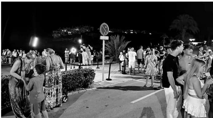
Moment de la revetlla durant les festes d'estiu.