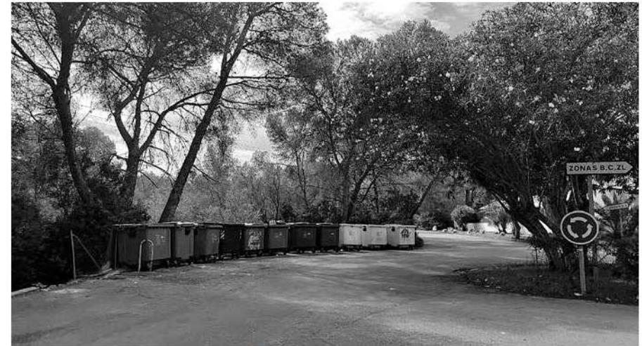
Zona de contenidors i senyal que indica diverses 'zones'.

parc o a la platja. Un dels problemes que assenyalen les famílies és que, quan els fills arriben a l'adolescència, «no hi ha res, no hi ha festa» per a ells. Com a qualsevol poble petit, infants i joves fan colles de diverses edats. Alguns estrangers també surten al passeig per sopar a la fresca durant l'estiu.