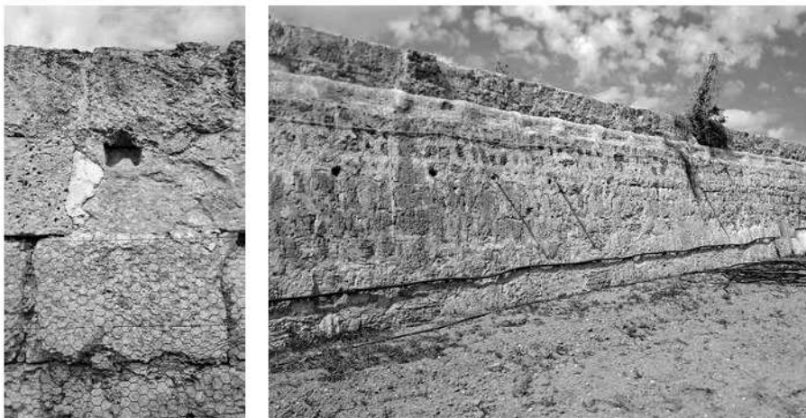
A la primera imatge, tancament del jardí, fet de blocs de marès, que el separa del camí i, per tant, fet a nivell alt, no a dins pedrera. A la segona, paret feta amb pedra de marès i darrera filada de cantó de marès que separa el jardí d'una altra propietat, totes dues endinsades dins una pedrera.