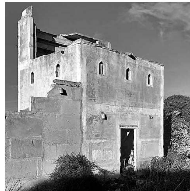
Columnes que formen part del sistema hidràulic i colomer amb finestres arabesques i pintat amb color que recorda a l'almangra.