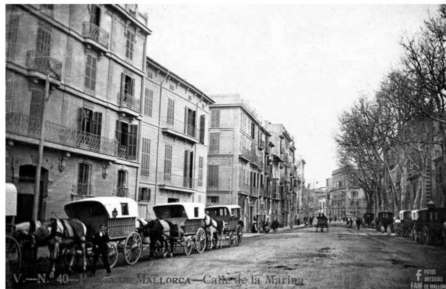
Aturada de carruatges privats a Ciutat.

El primer servei de diligència que s'establí a Mallorca fou el d'Inca, con-