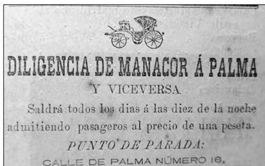
Publicitat de 1890.