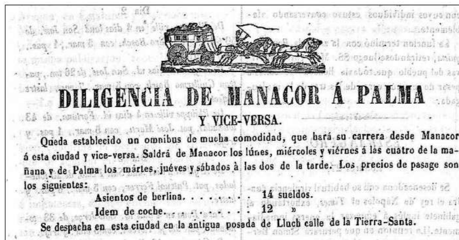
Publicitat de 1858.

Sabem que el mes de febrer de 1855 el birlotxo que portava el correu des de Manacor i Vilafranca sortia de la nostra vila cada dimecres i divendres a les 7.00 h i arribava a Ciutat a les 12.00 h del mateix dia. Aquesta dada és força interessant perquè ens permet confirmar que el correu estava cinc hores per recórrer els aproximadament cinquanta quilòmetres que separen Manacor de Palma, inclosa l'aturada que feia a Vilafranca, la qual cosa posa de manifest que la diligència correu prenia una velocitat mitjana de quasi deu quilòmetres per hora, segurament gràcies a les millores realitzades a la via d'ençà de 1846. Malgrat transportar el correu, admetia també passatgers, encàrrecs, cartes particulars i equipatges que no excedissin la ja clàssica mitja arrova de pes. Els bitllets es despatxaven, a Ciutat, a l'hostal de Campos del carrer de l'Esparteria. I, a Manacor, al carrer del Capità o de la posada de la diligència. Aquest darrer topònim ens fa creure que tal vegada els contractistes del servei eren manacorins.