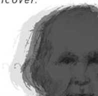
FIGURA 2. Cartell del taller de diàleg entre música tradicional i rap, 29 de gener de 2024.

Organitza Amics de la Institució Pública Antoni M. Alcover.