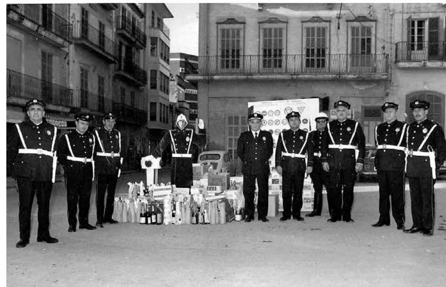
Manacor, any 70. La primera fotografia en color de l'entrega dels presents de Nadal a la Policia Local.