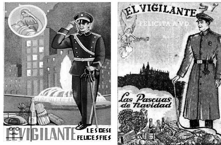
Distintes targetes de felicitació de Nadal de vigilants, de diversos llocs d'Espanya.

Una vegada que els obrien les portes, entregaven les targetes de felicitació nadalena especialment, i com ja hem mencionat, en les cases amb un poder