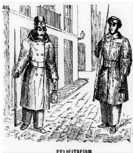
Tarjeta de felicitació nadalenca Any 1875