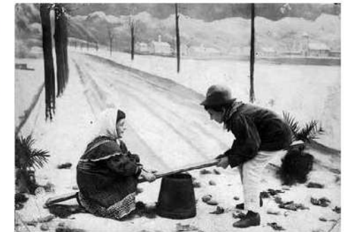
Postal de Nadal entregada per determinades perruqueries de Manacor als seus clients habituals a principi dels anys 1960. A canvi els clients solien agrair la felicitació i donaven al barber una gratificació. A la part de darrere de la present postal, escrit a mà es pot llegir: "Felices Fiestas de Navidad 1961. Gaspar".