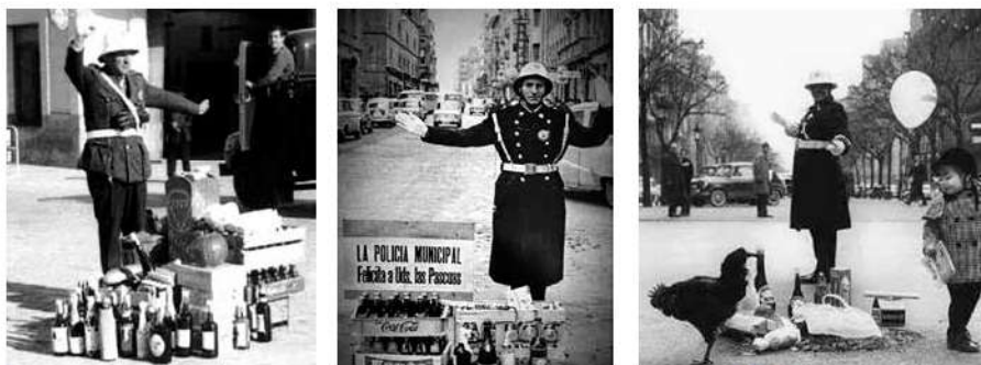
Diferents imatges d'anys distints, on es poden veure els obsequis als membres de la Policia Municipal. Tres són de Manacor i la resta segurament realitzades a Palma i altres indrets, durant els anys cinquanta, seixanta i setanta.

A final dels anys 1970, les targetes de felicitació nadalenca en general es varen popularitzar molt més en el disseny, temàtica, qualitat, etc., un costum d'origen sobretot dels països del nord d'Europa.