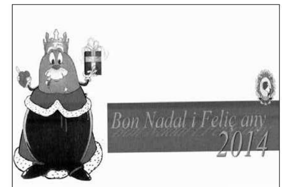
Targetes de felicitació nadalenca realitzades per la Policia Local de Manacor els anys 2013 i 2014.