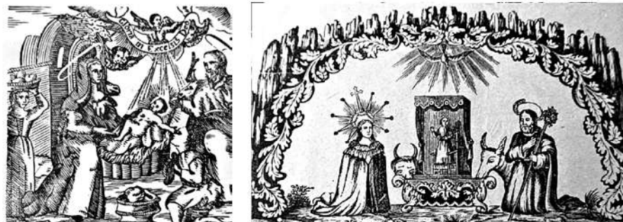
Xilografies d'iconografia de tipus religiosos que s'utilitzaven en les antigues postals de Nadal.

Solien ser compostes i impreses en un tipus de paper molt bast, de color rosa, blau, verd o blanc, i amb l'esdevenir del pas del temps s'anaven destenyint,