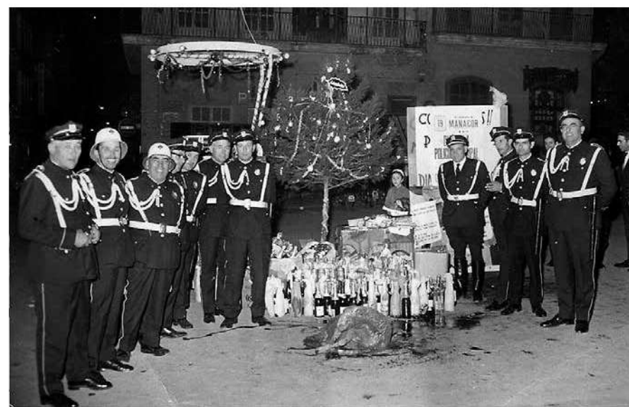
Fotografia de final dels anys 60 amb un arbret decorat amb adorns nadalencs.