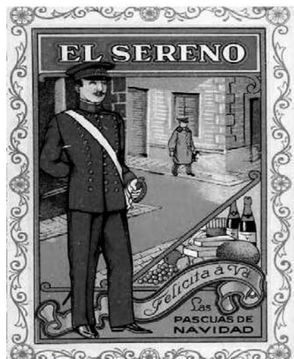
Postal de felicitació dels serenos per les festes de Nadal a principi del segle xx.

A partir d'aquells moments, va néixer el costum d'enviar targetes de felicitació nadalenca als familiars i amics per correu postal.