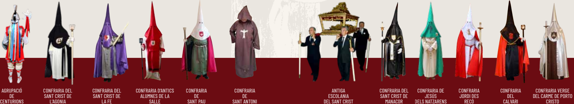
AGRUPACIÓ DE CENTURIONS