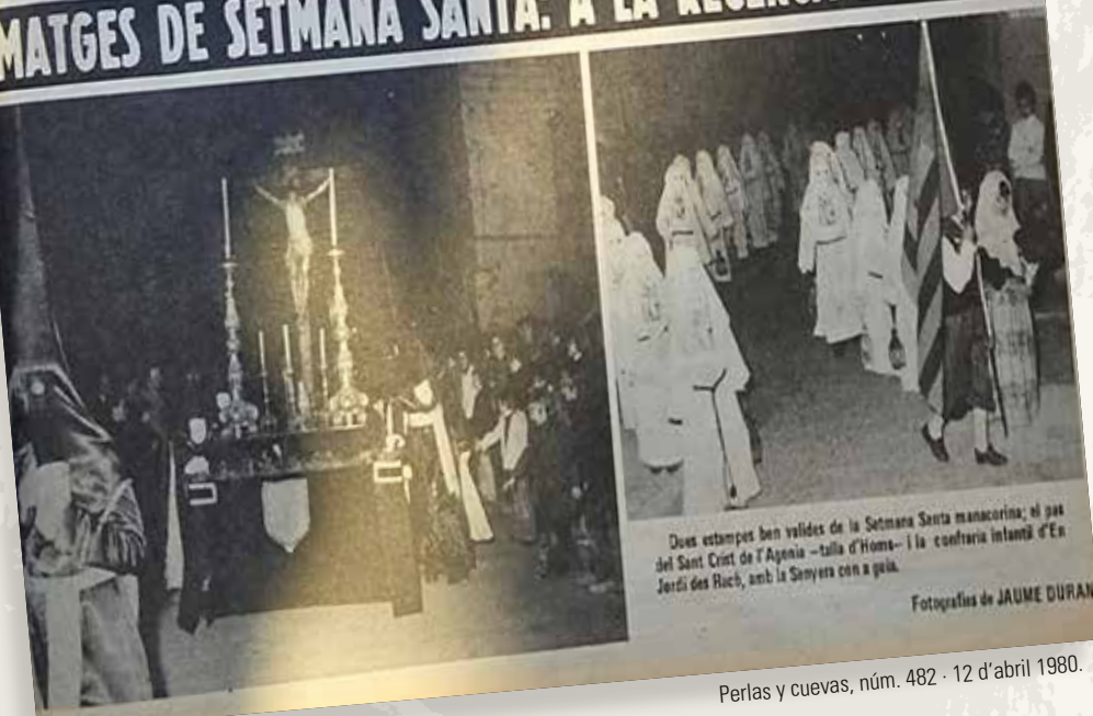
Dois estampes ben valides de la Setmana Santa manacorina: el pas del Sant Crist de l'Agonia —talla d'Home— i la confraria intant d'En Jordi des Ruch, amb la Sanyera com a guia.

Perlas y cuevas, núm. 482 · 12 d'abril 1980.