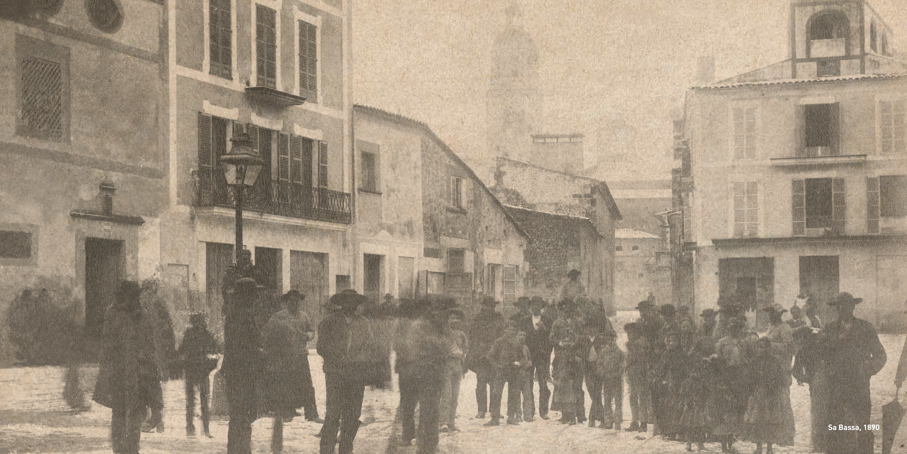
Sa Bassa, 1890