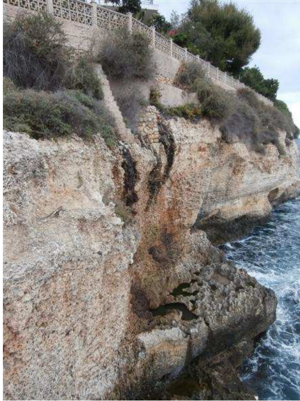
Foto 5 – Vista del punts de vessament d'aigües fecals al penya-segat – 11/10/2013