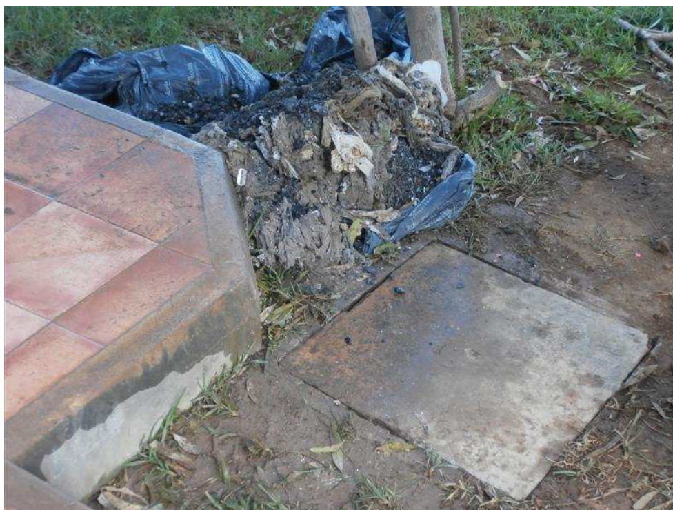
Foto 4 – Vista de un dels pous del hotel Chihuahua on s'ha detectat l'embús – 11/10/2013