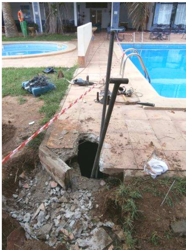
Foto 3 – Vista de un dels pous del hotel Chihuahua on s'ha detectat l'embús – 11/10/2013