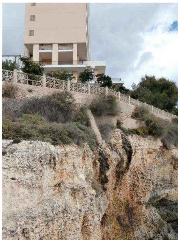
Foto 1 – Vista del penya-segat del costat nord de Cala Romaguera i del hotel Chihuahua – 10/10/2013