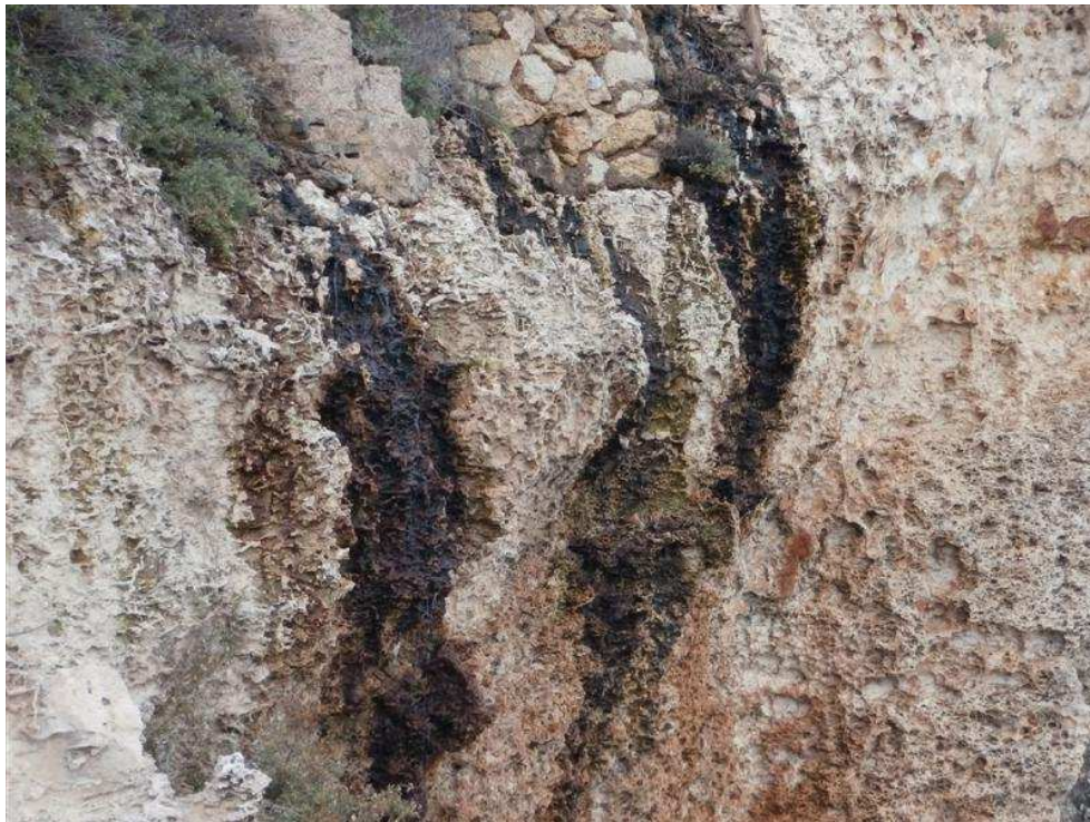
Foto 6 – Detall dels vessament d'aigües fecals al penya-segat - 11/10/2013